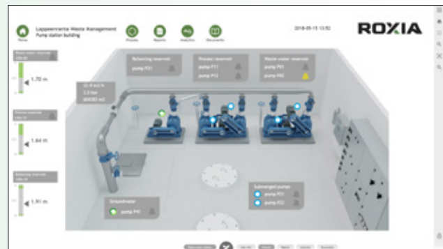
Estación de bombeo de EKJH y la vista remota en Roxia Malibu™.